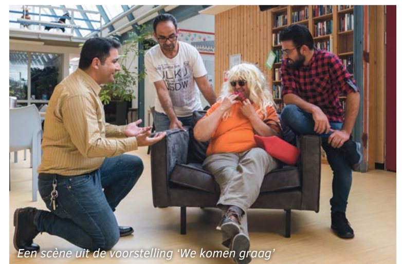
Een scène uit de voorstelling 'We komen graag'

Op het plein van de Bockxmeerschool zetten de kinderen hun kelen open en putten uit hun repertoire. Voor de jonge bezoekers organiseert Stichting Netwerk knutselactiviteiten.