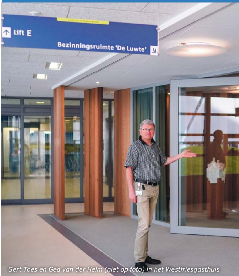
Gert Toes en Gea van der Helm (niet op foto) in het Westfriesgasthuis

Leden van de Somalische gemeenschap in Hoorn-Noord ontvangen wijkbewoners in hun prachtige traditionele kleding. Zij richten een aantal feestelijke tafels in. Er zijn bijzondere Somalische gerechten. Er wordt een expositie ingericht. En men wil vooral ontmoeten.